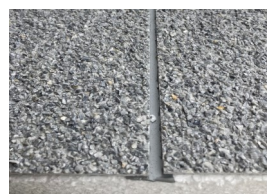
Butyltape tilpasset pladefarve (alternativt akrylmaling)